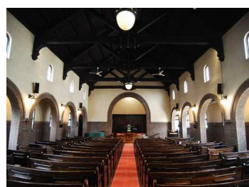
日本基督教団大阪教会