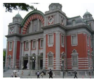
大阪市中央公会堂