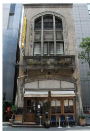
旧大阪市消防局今橋出張所